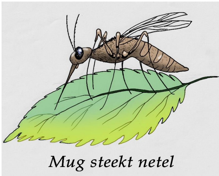
Mug steekt netel